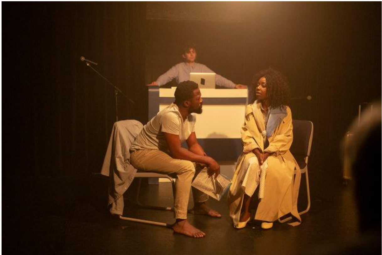
"A bout de sueurs", texte Hakim Bah, m.e.s. Hakim Bah et Diane Chavelet

laissé les deux garçons seuls, livrés à eux-mêmes. Ils vont alors tout entreprendre pour tenter de rejoindre leur mère, au péril de leur vie.