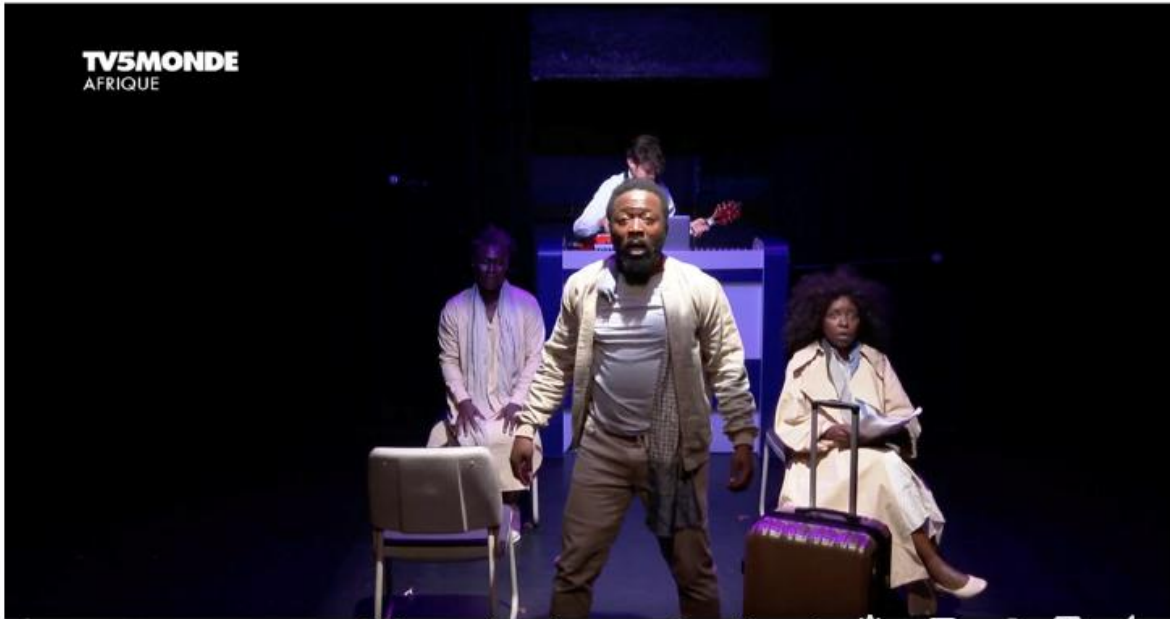
Théâtre : "A bout de sueurs" de Hakim Bah