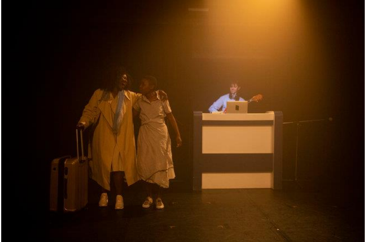
"A bout de sueurs", texte Hakim Bah, m.e.s. Hakim Bah et Diane Chavelet © Raphaël Kessler

« Si le sol te brûle les pieds c'est que tu ne cours pas assez vite »